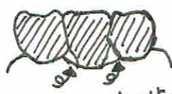
ブリッジと歯ぐきの間