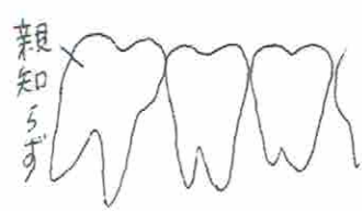
< 例1 >

親知らずは、上下左右一番奥に生えている歯なので、維持が難しいです。歯ブラシが届きにくい為、虫歯になりやすいのです。